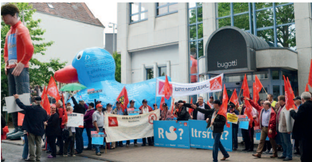
Protestaktion in Herford vor der Firma bugatti: Mit Trillerpfeifen und Trommeln unterstützen Textiler und Bekleider aus der Region die Forderungen nach Tarif-Regelungen zu Altersteilzeit, Übernahme und Belastungsabbau.